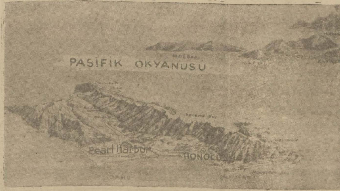
Haval adalarını gösterir temsili resim

Ankara 20 (Husul) — Hükümet, bayramın ayın sonuna yaklaştığını hesab ederek, memurların Sonkânun maaşını bayramdan evvel verme kararını vermiştir. Maliye Vekâleti hazırlanacaklara başlamış ve defterdarlıklara lazım gelen emri vermiştir.